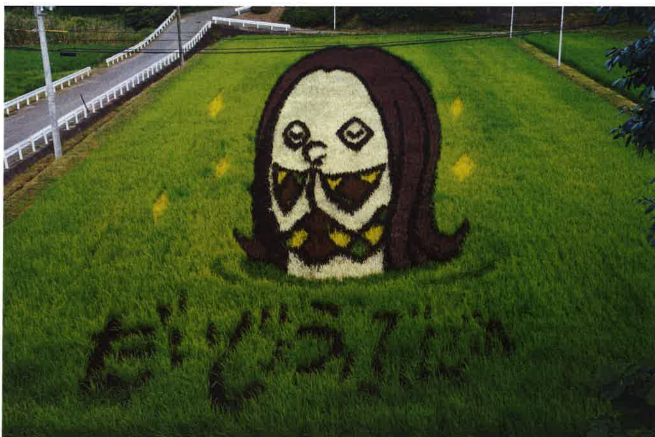
福島県双葉町 アマビエ（コロナ退散）